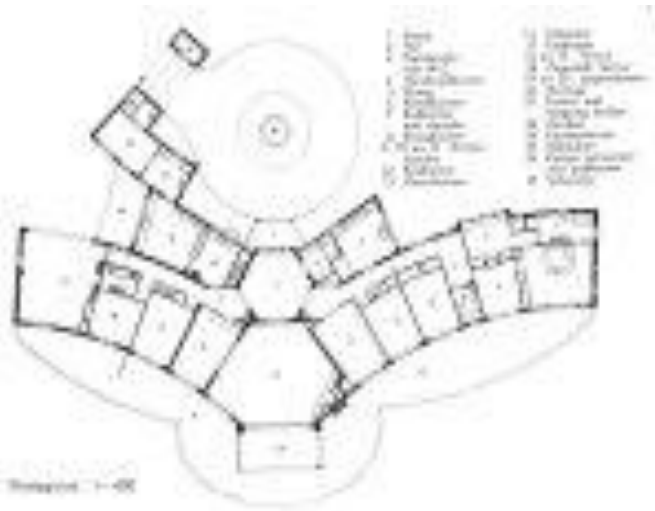
De Ark van Ome Freddie Heineken.

Een complex van woonhuizen gebouwd in opdracht van Freddie Heineken, tussen 1954 en 1955 aan de Boerhaaveweg te Noordwijk door de architect A.H. Wegerif Gzn. met de namen: 'De Ark', 'De Duif', 'De Raaf', 'De Ararat'.